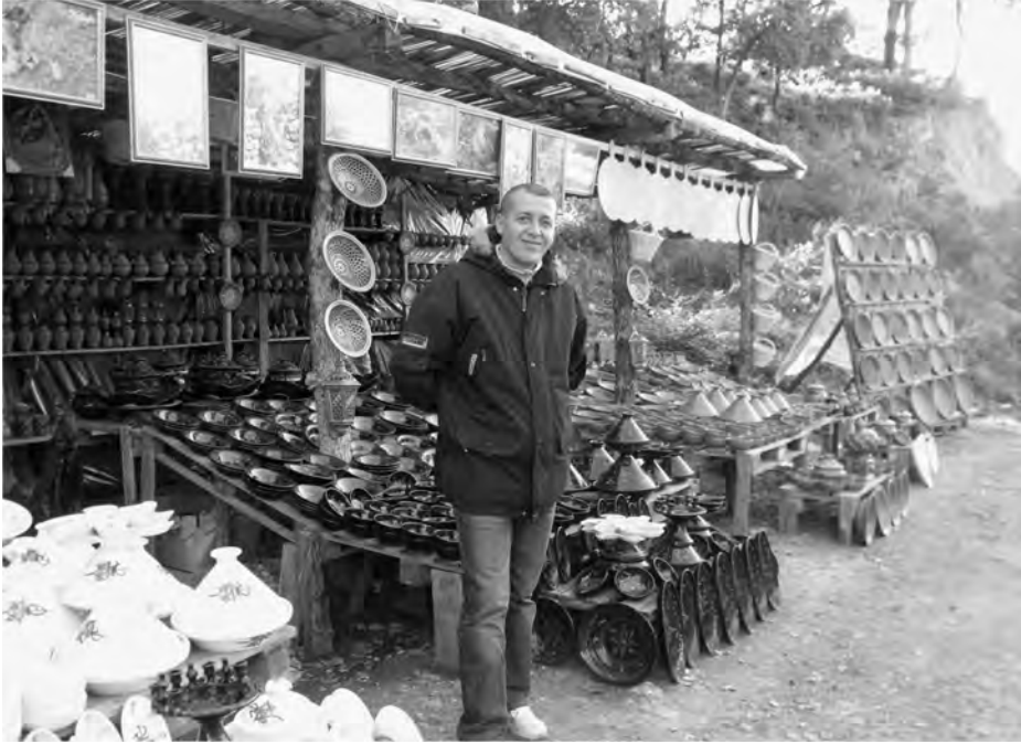
Photo 1 – Un vendeur à côté de son stand de vente de poterie traditionnelle