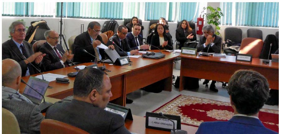
Discussion entre des représentants du secteur privé et les membres du réseau MED-Amin lors de sa 8ème réunion à Meknès (Maroc), les 22-23 janvier 2019.

La disponibilité d'une information de qualité sur les niveaux de production, de consommation, d'échanges commerciaux, de pertes et de stocks, sans parler des prix, est critique pour étayer toute prise de décision. C'est un objectif commun à tous les acteurs de la filière céréalière, publics et privés.