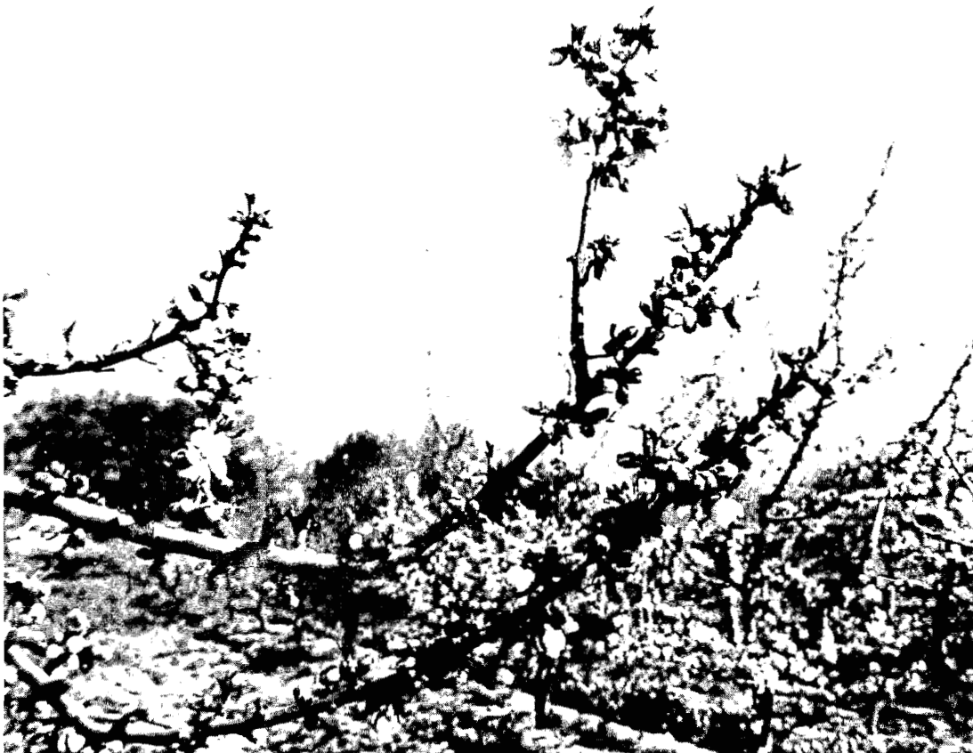
Figure 1. Branche au moment de la floraison avec un nombre important de fleurs.

Capacité d'autopollinisation : La culture de l'amandier dans des plantations monocultivars sera seulement possible du point de vue commercial s'il existe une bonne capacité d'autogamie naturelle dans des cultivars génétiquement autocompatibles (Vasilakakis et Porlingis 1984 ; Weinbaum, sous presse). C'est pourquoi, les fleurs de cette sélection ont été examinées et l'on a observé que les stigmates se trouvent entre les anthères (Figure 4), d'où l'on peut déduire une capacité d'autogamie naturelle (Weinbaum, sous presse).