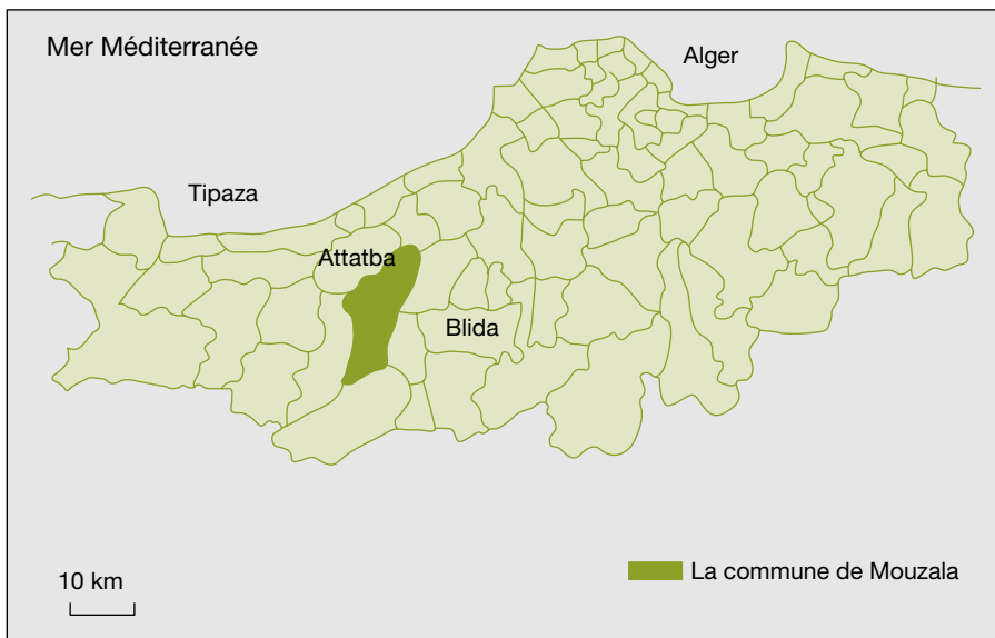
Figure 1. La position géographique de Mouzaïa (zone d'étude).

La typologie de comportement des agriculteurs enquêtés dans les EAC de l'ex-DAS Boudjema Ikhlef a été établie sur la base des critères déterminant le partage du foncier et les arrangements informels entre attributaires et preneurs : réalisation d'investissements